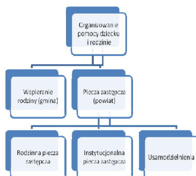
Rys. 1. Organizacja wspierania rodziny i systemu pieczy zastępczej

Kompleksowo organizację wsparcia rodziny i systemu pieczy zastępczej przedstawia poniższy schemat (rys. 1.).